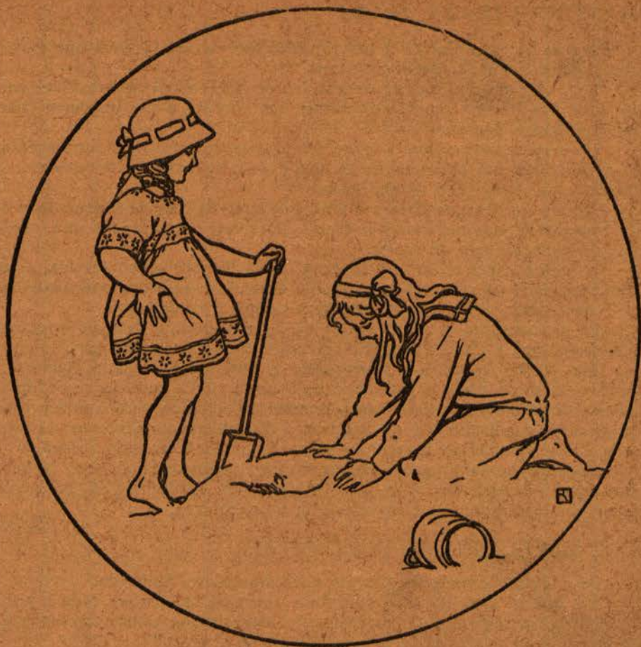
ILUSTRAÇÃO INÉDITA DE M. RAQUEL R. G. OTTOBINI