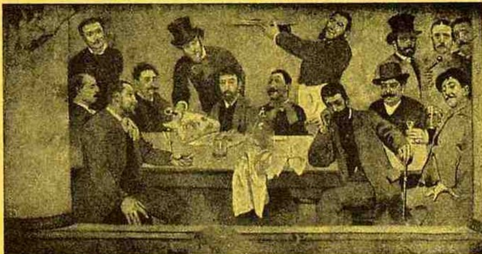
COLUMBANO — O GRUPO DO "LEÃO".

Esta segunda sessão não se realizou por causa do movimento revolucionario desse dia, 19 de Outubro. Como estivesse, durante longo periodo, a cidade em estado de sitio o