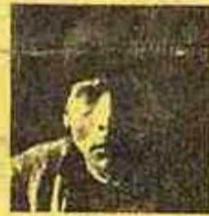
Santa Rita Pintor