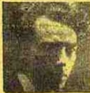
Afonso de Bragança