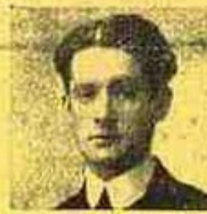
Ponce de Leão