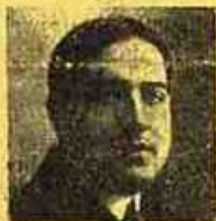
Mário de Sá Carneiro