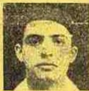
Amadeu de Sousa Cardoso