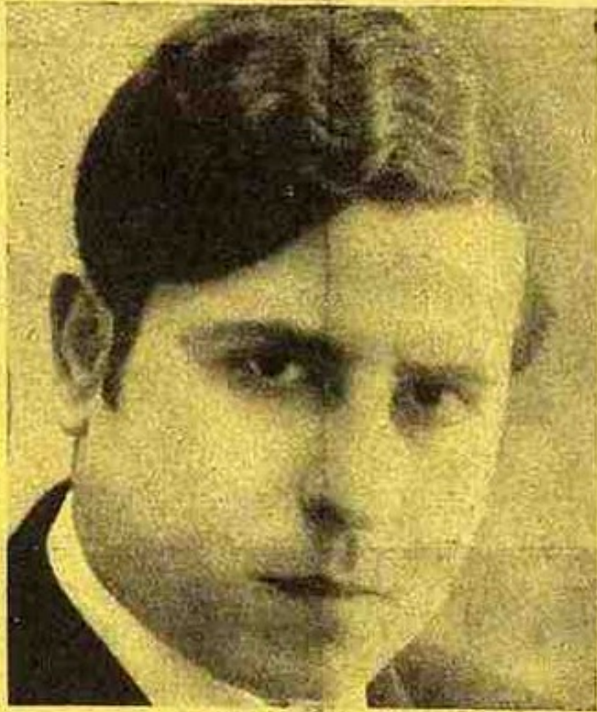
RAMÓN GÓMEZ DE LA SERNA

Ramón é diferente em todos os livros — porque os seus livros são instantes.